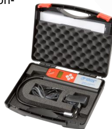
HydrogenPower im Gerätekofter (Gerätekofter optional)