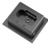
Dockingstation/Ladeschale (LxBxH ca. 78x93x39mm) für HydrogenPower (optional)