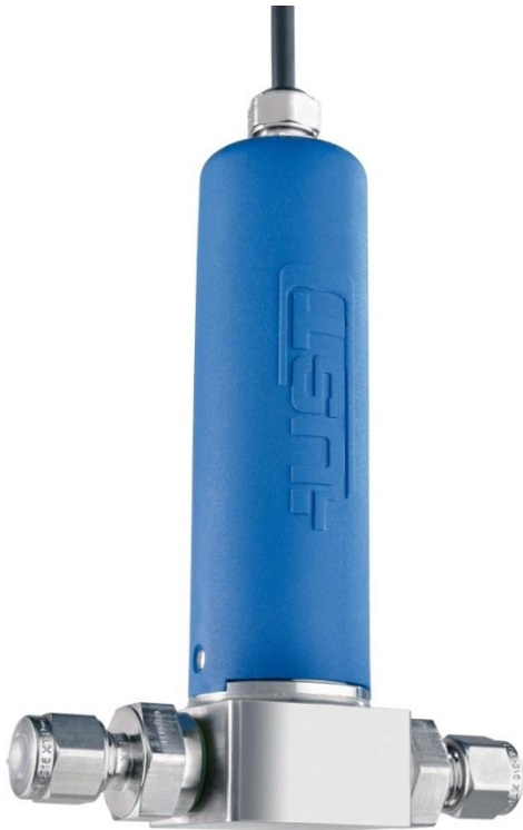
H 2 -Semicon ® -Sensor-System pi - Industriekopf - Variante für Normaldruck - (Patent: EP000001621882B1 2) )